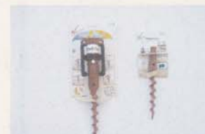
Stehfix + Sandwurmi