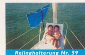
Relinghalterung Nr. 59